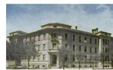
EDUCATORIO DELLA PROVVIDENZA

Corso Trento 13 – 10129 TORINO Tel. 011/ 568149